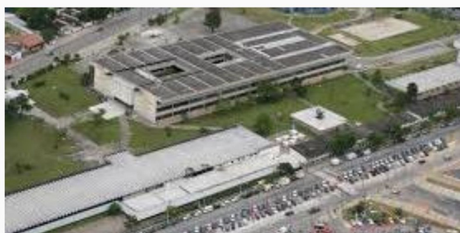
Centro Universitário oferece informações sobre diversos cursos.

O Centro Universitário Braz Cubas promove, desde o dia 27/10, a Feira de Profissões, a Fepró On. O evento é on-line segue até esta quinta-feira (29).